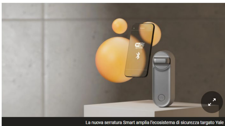
La nuova serratura Smart amplia l'ecosistema di sicurezza targato Yale

La nuova serratura offre agli utenti la libertà di ottimizzare l'uso delle serrature smart sfruttando le integrazioni esistenti con i principali assistenti vocali